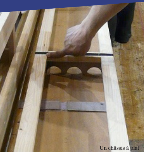
Un châssis à plat

Le menuisier réalise tous les éléments de décors en bois.